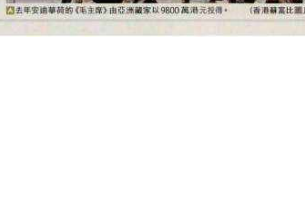
蘇富比亞洲主席黃林詩韻於去年拍賣，成交價為1.1億港元。