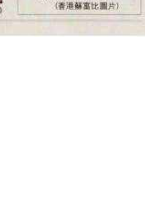
蘇富比亞洲主席黃林詩韻於去年拍賣，成交價為1.1億港元。