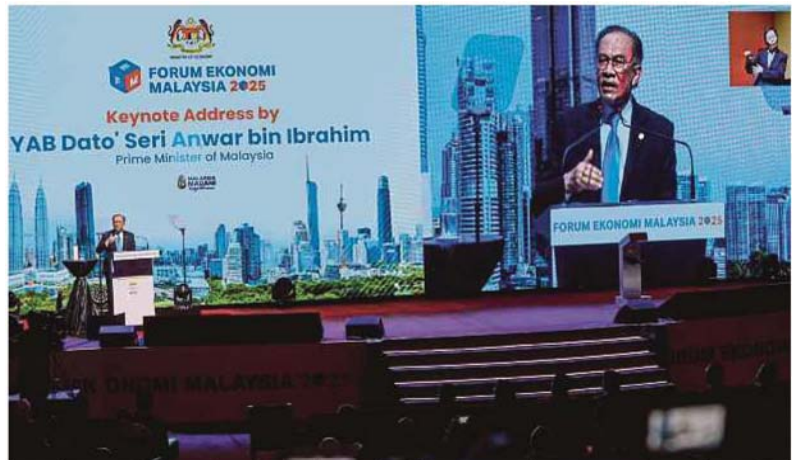
Anwar berucap pada Forum Ekonomi Malaysia 2025 di Kuala Lumpur, semalam.

"Pada masa sama, kita ingin memperhalusi kepakaran kita dalam minyak dan gas, semikonduktor dan kewangan Islam supaya kita boleh menjadi peneraju pasaran global dalam setiap bi-