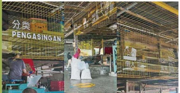
▲悬挂的告示牌以中文和马来文展示江鱼仔分类的步骤。