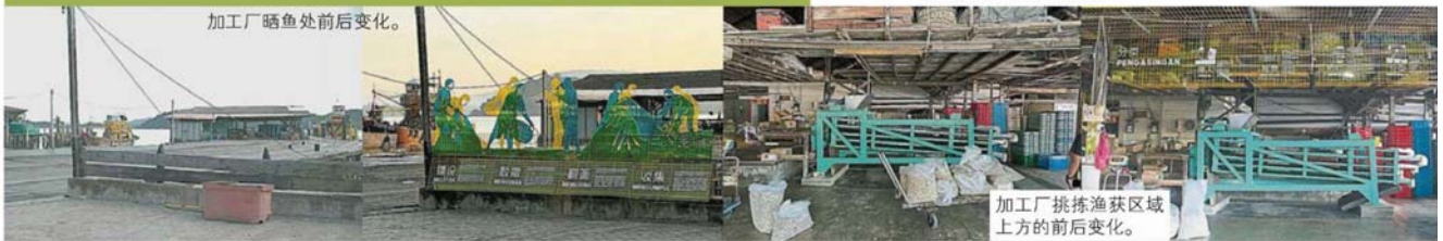
加工挑拣渔获区域上方的前后变化。